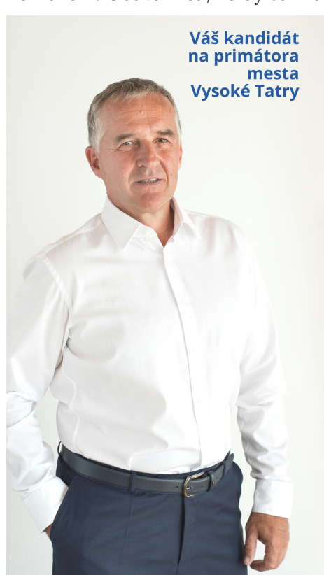
Váš kandidát na primátora mesta Vysoké Tatry

Čo je ešte horšie, strácame nádej, že to môže byť lepšie . Akceptujeme tento stav a prispôbujeme sa neutešenej realite, namiesto toho, aby sme sa ju snažili zmeniť. Bežne sa stretávam s ľuďmi, ktorí mi úprimne povedia svoj názor na dianie v meste, ale zároveň dodajú: „Vieš, ja to nahlas povedať nemôžem. Obávam sa, že by to mohlo mať následky.“