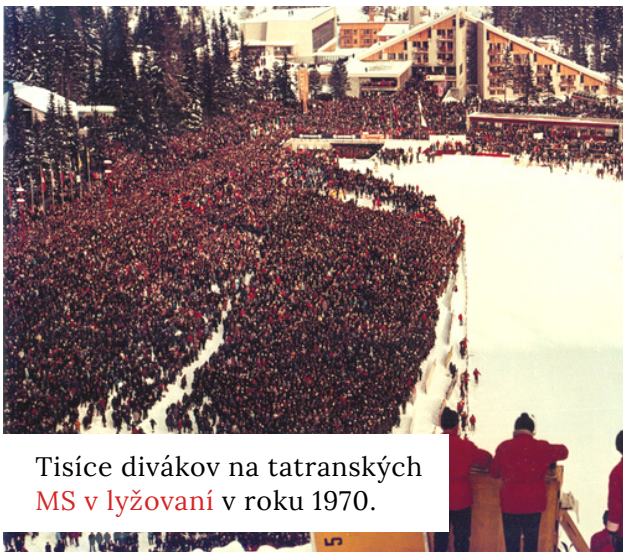
Tisíce divákov na tatranských MS v lyžovaní v roku 1970.

Každý s kým sa rozprávam o tom, čo je potrebné vo Vysokých Tatrách zmeniť, mi odpovie, že zastaviť výstavbu. Nie je to jednoduché, ale aj tento problém je riešiteľný. V prípade, že zasadnem na stoličku poslanca mestského zastupiteľstva, bude jednou z mojich priorit revízia územného plánu mesta, následná vizualizácia toho, čo už bohužiaľ nepôjde zrušiť a nakoniec predloženie návrhu o stavebnej uzávere vo Vysokých Tatrách s výnimkou verejnoprospešných stavieb, ako sú mestské nájomné byty a podobne. Územie nad Cestou slobody musí byť pre stavebníkov tabu!