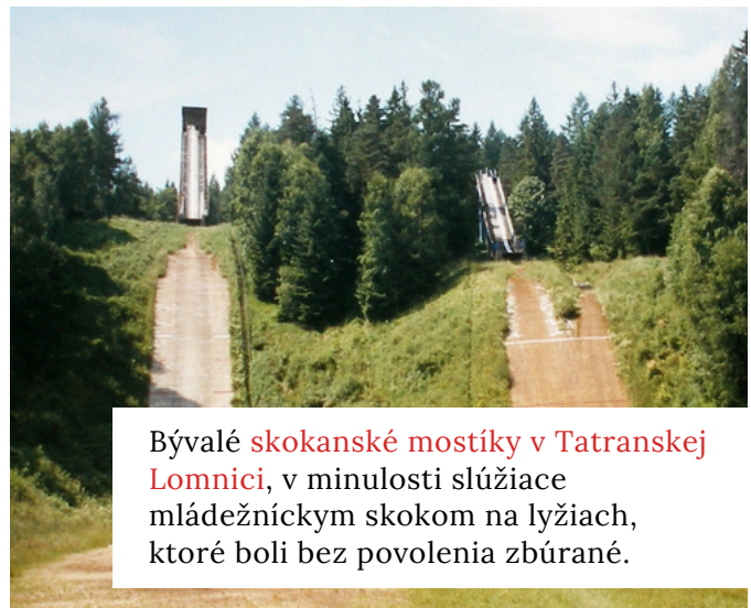
Bývalé skokanské mostíky v Tatranskej Lomnici, v minulosti slúžiace mládežníckym skokom na lyžiach, ktoré boli bez povolenia zbúrané.

Zároveň budem presadzovať, aby mesto Vysoké Tatry v spolupráci so Správou Tanap-u predložili návrh zákona o stavebnej uzávere aj do Národnej rady SR a to z dôvodu, aby zrušenie tohto uznesenia nebolo v budúcnosti bez problémov realizovateľné. Chráňme a opravujme si stavby, ktoré tu pre nás vybudovali naši predkovia, viď stanica starej lanovky v Tatranskej Lomnici. Nedovoľme, aby na mieste hotela MS 70, ktorý bol zhorený, vyrástol nový apartmánový dom. Nedovoľme, aby sa z Lomnice a Smokovca stalo druhé Štrbské Pleso, kde bezhlavá výstavba apartmánových bytov totálne zničila jednu z najkrajších osád na Slovensku. Pamätajme, že toto všetko majú v rukách poslanci a primátor mesta Vysoké Tatry.